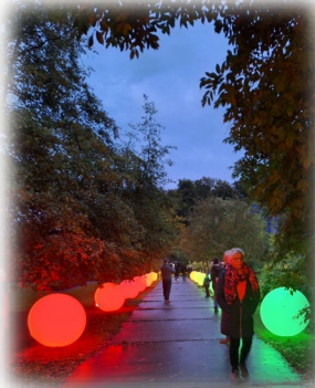
Der Frauentreff besucht das Lichterfest im Botanischen Garten und wandert auf den Lahnbergen