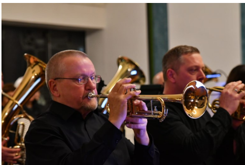
Adventsnachmittag vom „Tischlein-deck-dich“