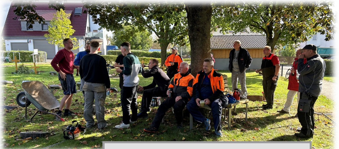
Heckenpflege Fleißige Helfer auf dem Friedhof Großseelheim