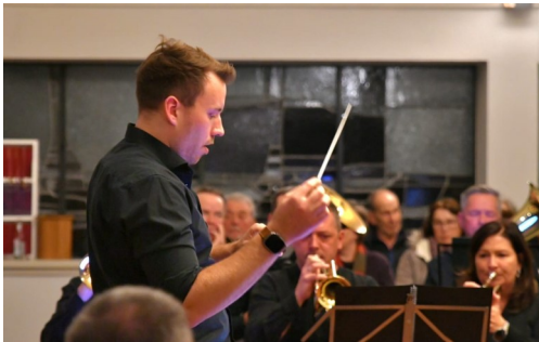
Adventskonzert des Posaunenchores