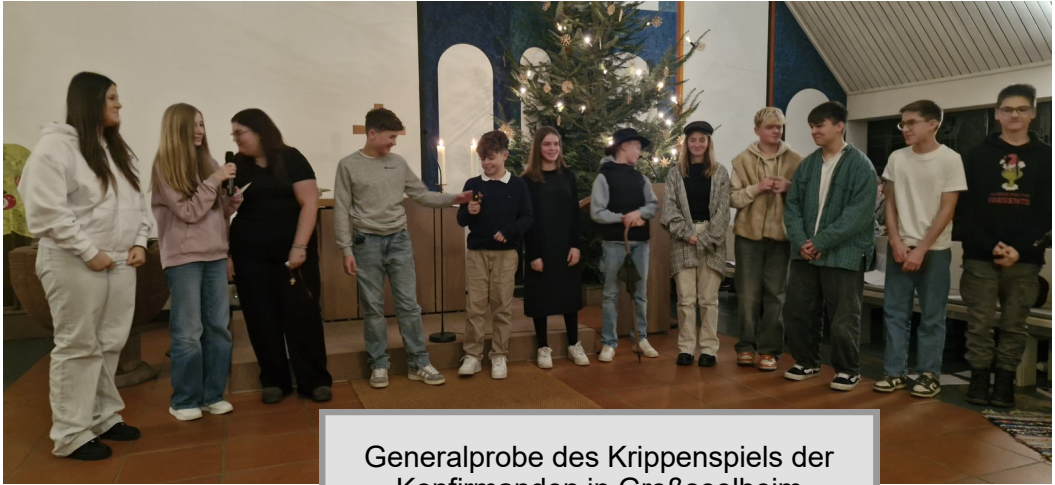
Generalprobe des Krippenspiels der Konfirmanden in Großseelheim